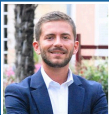
ENSEMBLE POUR LARDY