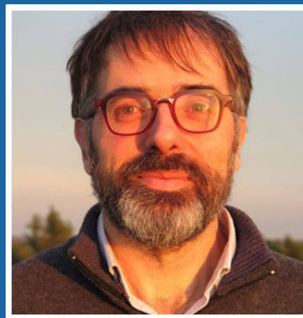
LES ÉCOLOGISTES D'ENTRE JUINE ET RENARDE